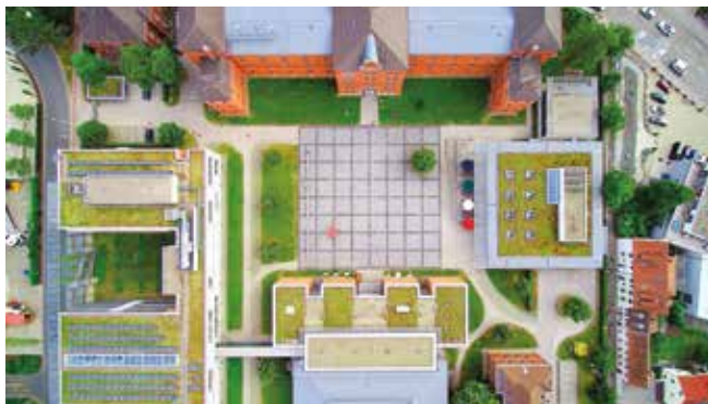
Der Campus der Hochschule Ansbach von oben