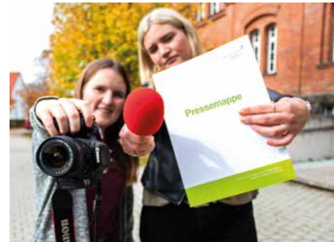
Gewappnet für das Berufsfeld PR und Unternehmenskommunikation

Die Vielfalt des Studiums spiegelt sich in den breit gefächerten Berufsaussichten wider. Neben dem fundierten theoretischen Grundwissen schätzen Arbeitgeber aus der PR- und Unternehmenskommunikationsbranche besonders die praktischen Erfahrungen, die im Studiengang PUK erworben werden. Dieser Masterabschluss bietet somit die besten Voraussetzungen, um im Bereich der PR, Presse- und Öffentlichkeitsarbeit oder Unternehmenskommunikation durchzustarten.