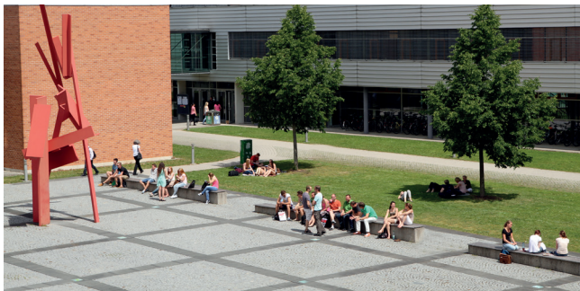
Der Campus Ihrer Hochschule

Unser Studienangebot in den Studienfeldern Wirtschafts-, Ingenieur- und Biowissenschaften, Informatik und Medien deckt ein breites Spektrum ab. Mit den etablierten Studiengängen der Fakultät Medien verfügt die Hochschule Ansbach über umfangreiches Know-how und langjährige Erfahrungen, wovon Sie bei der Umsetzung von medien-gestützten Bildungsangeboten profitieren können.