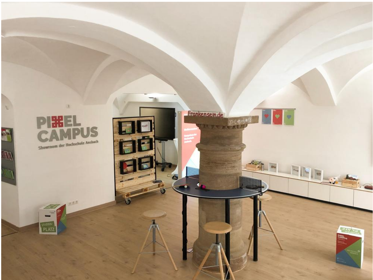
Abbildung 3 - Pixel Campus in Ansbach