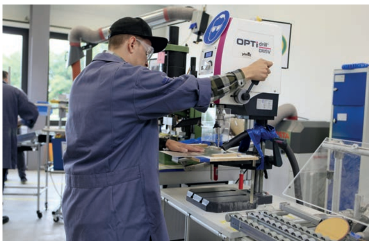
In der Lehrfabrik am Campus Herrieden lernen die Studierenden anhand von praktischen Übungen die TPM- und Lean-Methoden kennen.

Die Interessenten für den Studiengang Wertschöpfungsmanagement haben in der Regel eine berufliche Ausbildung im gewerblich-technischen oder auch im administrativen Bereich. Ideal für die Anrechnung ist eine vorhergehende berufliche Weiterbildung. Hinzu kommt, dass die Teilnehmerinnen und Teilnehmer die Unterstützung des Unternehmens benötigen, damit die modulbezogenen Projekte im eigenen Arbeitsumfeld durchgeführt werden können. Selbstverständlich muss auch persönlich das Interesse und der Wille vorhanden sein, Prozesse im Unternehmen ständig zu verbessern. Wichtig sind auch Teamfähigkeit, das Interesse analytisch und systematisch zu arbeiten und die Möglichkeit, Berufsalltag, Privatleben und Studium zeitgleich unter einen Hut zu bringen.