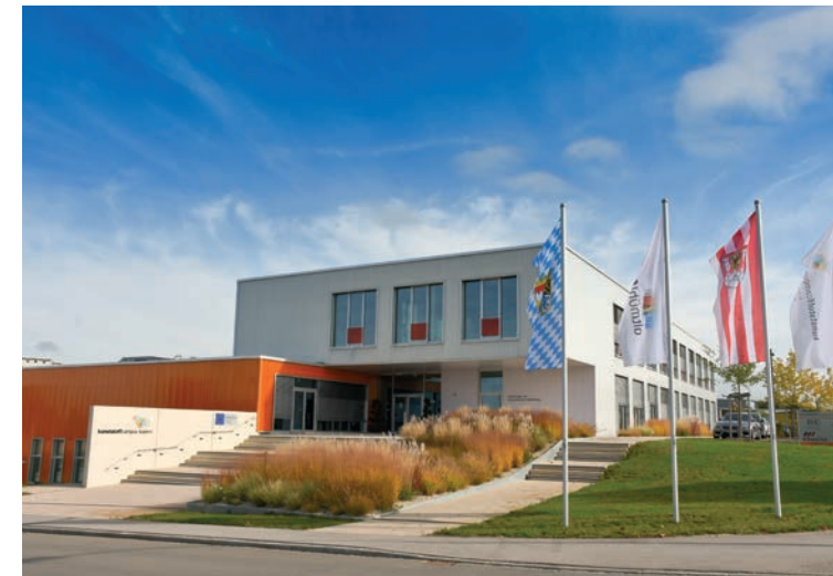
kunststoffcampus bayern - Technologie- und Studienzentrum Weißenburg, Richard-Stücklen-Str. 3

Ein berufsbegleitendes Studium am Campus Weißenburg – direkt in der Region – ist eine Möglichkeit, mit der Sicherheit und dem Einkommen eines festen Jobs, bereits erworbene Qualifikationen zu verbessern und neue Schritte auf der Karriereleiter anzustreben.