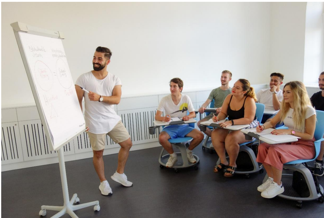
Abbildung 2 - Angenehme Lernatmosphäre am Campus Rothenburg