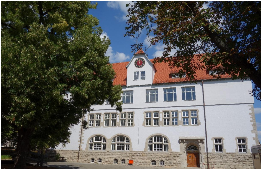
Abbildung 1 - Der Campus Rothenburg