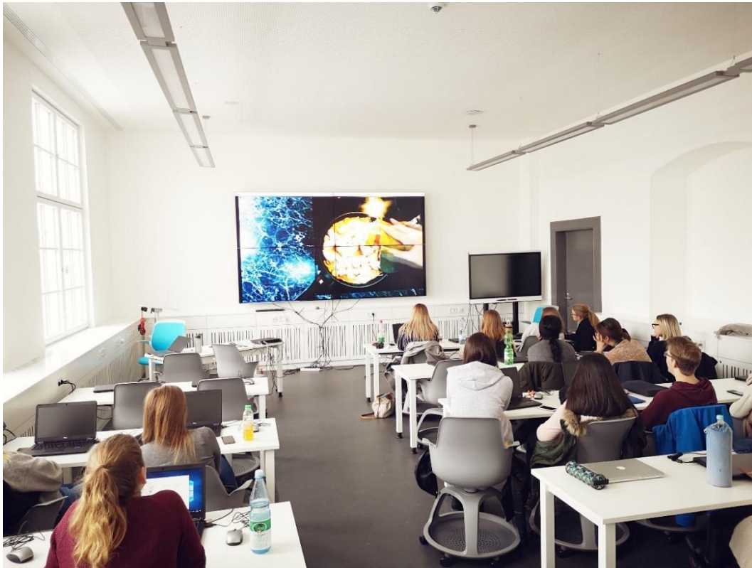
Abbildung 3 - Angenehme Lernatmosphäre: IT-Raum

Neben den Seminarräumen verfügen wir auch am Campus Rothenburg über einen eigenen IT-Pool, den wir intensiv für Veranstaltungen mit Einsatz digitaler Medien nutzen.