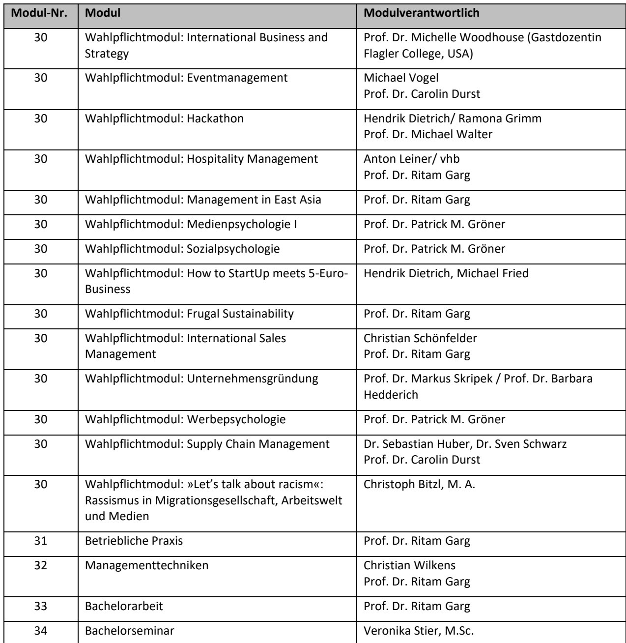
Tabelle 2 – Modulübersicht mit Modulverantwortlichen