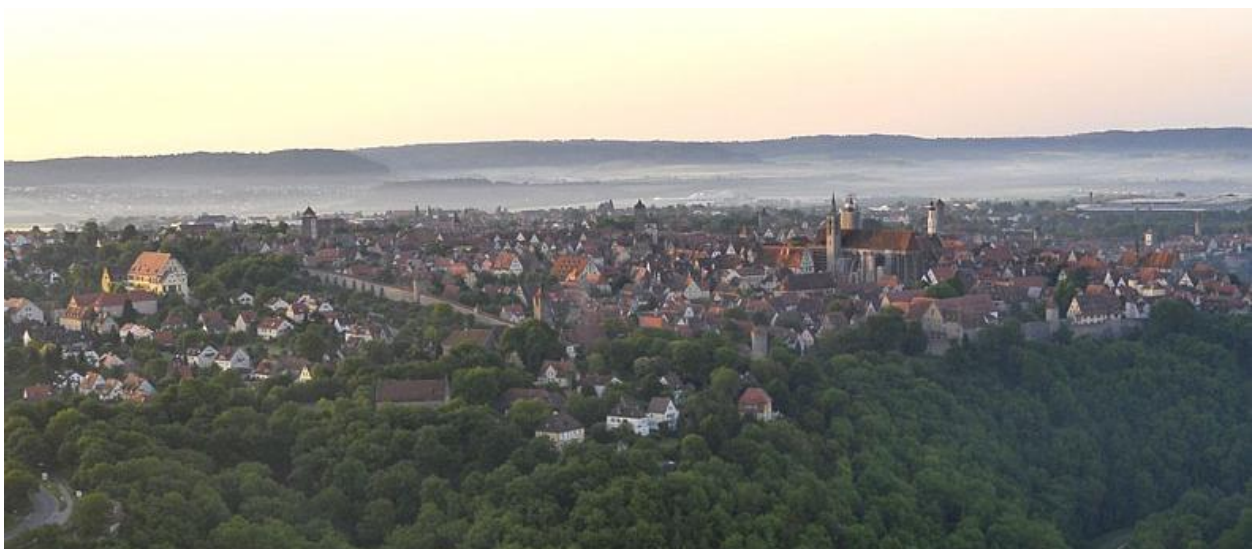
Abbildung 4 - Skyline von Rothenburg

Orientieren Sie sich vor Ort: Vom Bahnhof zum Campus sind es etwa 5 Minuten zu Fuß. Der Campus liegt direkt an der historischen Stadtmauer. In die sehenswerte Altstadt mit schönen Plätzen, Cafés und Restaurants gelangen Sie in wenigen Minuten. Für Tipps und Fragen wenden Sie sich gerne an das Campus-Team. Hier erhalten Sie auch Infos zu Sonderkonditionen, die uns aufgrund enger Vernetzung mit der Stadt Rothenburg zur Verfügung stehen (z.B. Parkkarte für Studierende)